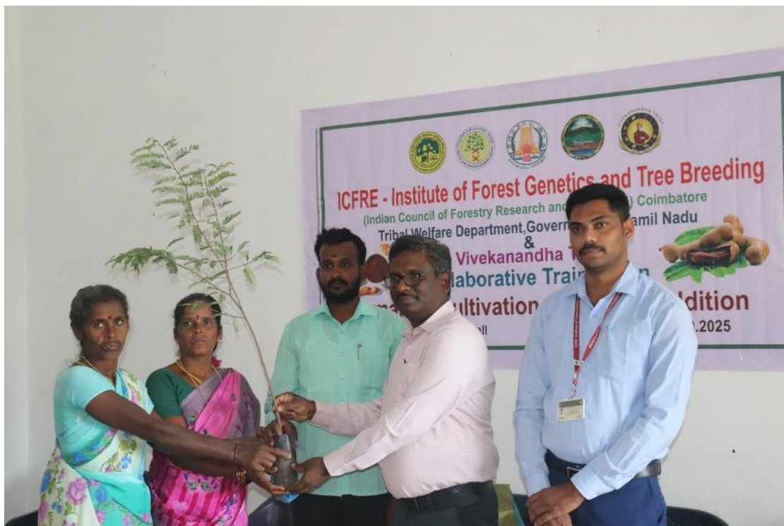
Distribution of Quality planting stock of Red Tamarind to the participants