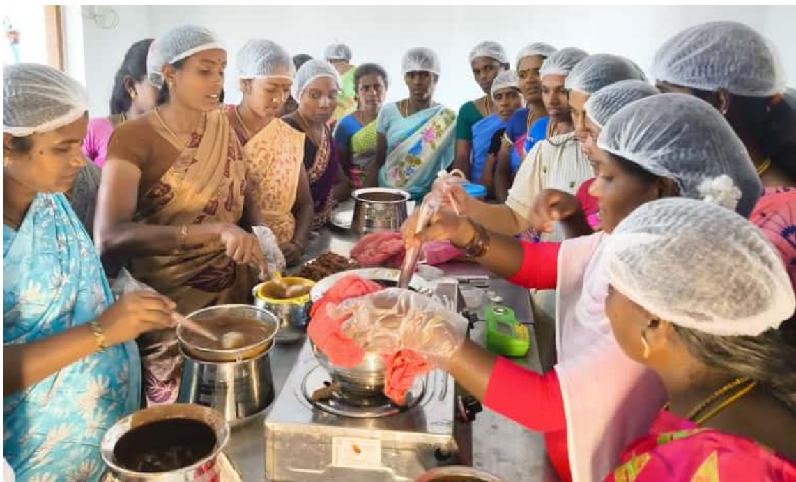
Hands on Training on Production of Tamarind paste at Jawadhu hills