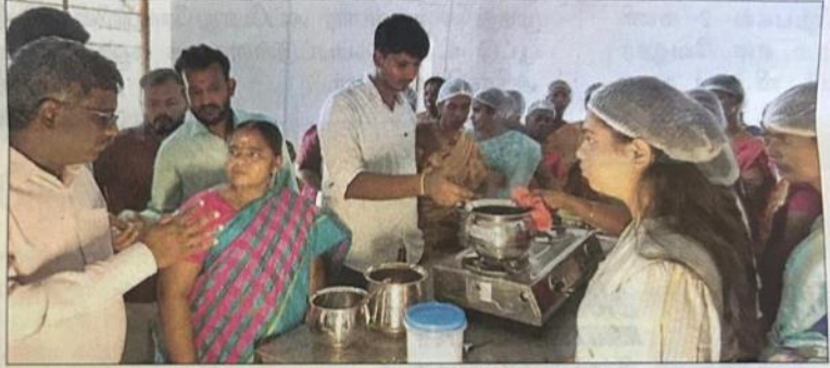
● திருவண்ணாமலை மாவட்டம் ஜவ்வாது மலைவாழ் பழங்குடியின பெண்களுக்கு புளி மதிப்புக் கூட்டல் பயிற்சி அளிக்கப்பட்டது.

இதில், விஞ்ஞானி மாயவேல் பேசும்போது, "இந்தியாவில் விளையக் கூடிய புளி உற்பத்தியில் தமிழகம் 25 சதவீதம் பங்கு வகிக்கிறது. அதிலும் ஜவ்வாதுமலை மிகவும் முக்கிய பங்கு வகிக்கிறது. சிவப்பு ரக புளி பல்வேறு மருத்துவ குணங்கள் உடையது. புளி சாதாரணமாக