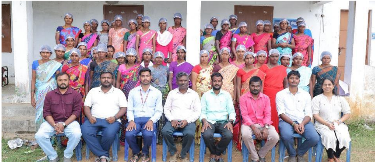
Group Photo of training on Tamarind Cultivation & Tamarind Value Added Products at Jawadhu hills